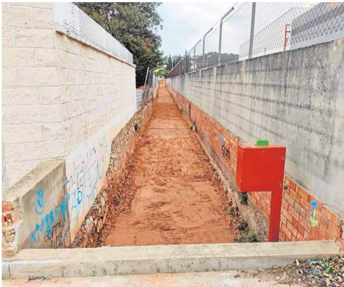
El barranco Fosc funciona como un colector exterior que recoge el agua de las zonas altas. A. T.

Además, también se busca una solución para canalizar las escorrentías que por la pendiente llegan a las alcantarillas de esta zona de la ciudad y que no puede asumir por la gran cantidad de litros por metro cuadrados que suelen descargar en pocas horas.